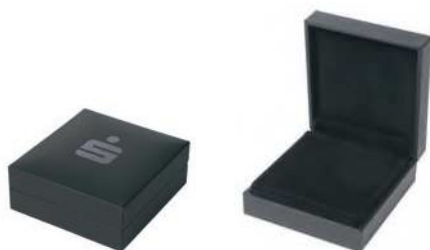
Etui mit Sparkassen-Logo (Schwarz)

Ob als Geschenk, zur Aufbewahrung oder zum Präsentieren, wir haben die ideale Verpackung für Ihre Barren und Münzen (bei Barren ab 50g nicht geeignet).